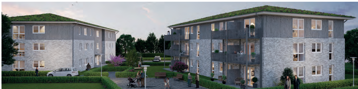
Alveslohe: Neue Dorfmitte, Reihen- und Mehrfamilienhäuser

Die Abb. (Visualisierungen) sind nur beispielhaft zu sehen, sie geben die endgültige Bauausführung nicht wieder.