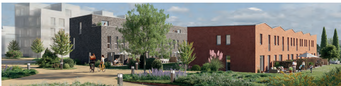
Schleswig an der Schlei: Luther Quartier, Reihen- und Mehrfamilienhäuser