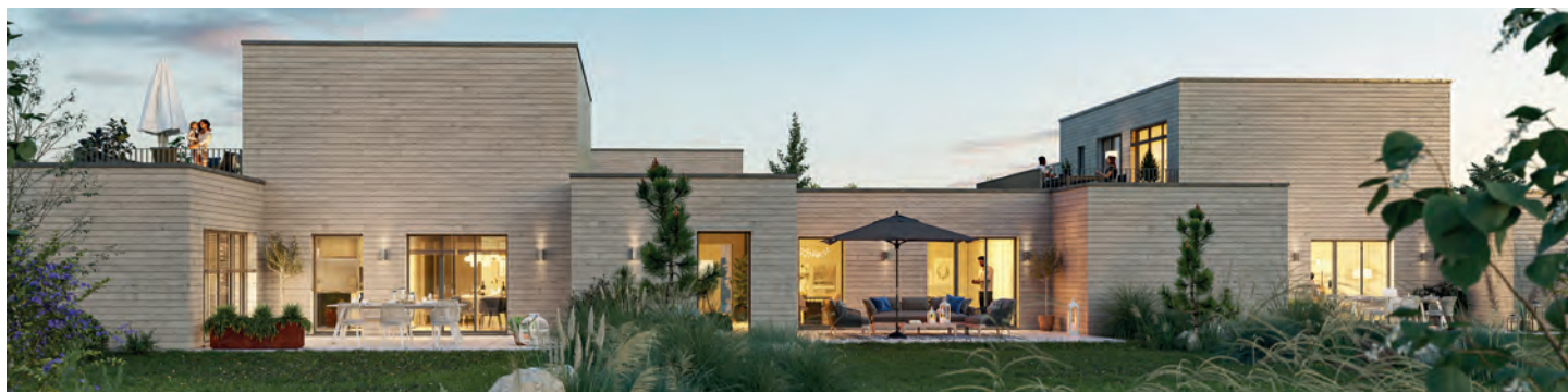
Kappeln: KAP.ONE, Atrium-Bungalows

Rufen Sie uns gern an. Telefon: +49 4193 901151 Ihr Manke-Team